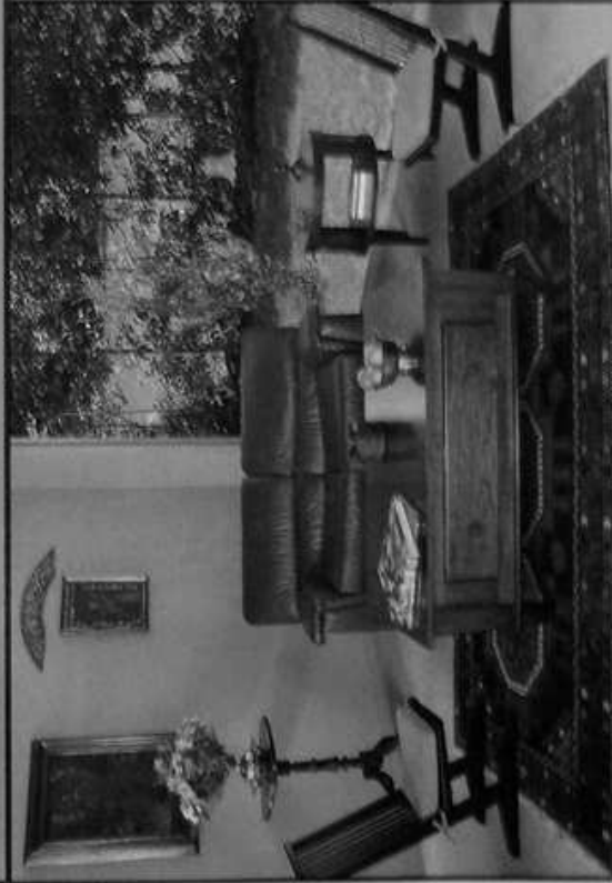
Foto: Fotografía en una habitación