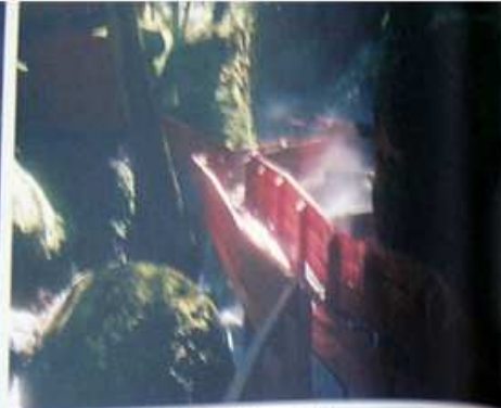
Una rampa de módulos de cobertal fue construida siguiendo el curso de la quebrada, a la larga de 450 metros, para llevar con seguridad al visitante hasta las termas.

donde se han instalado baños construidos en la misma madera de la rampa y sin tallar ni un solo clavo, lo que genera una armonía total con el entorno.