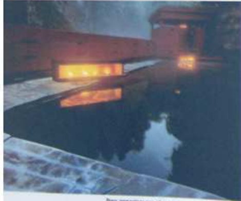
Para armonizar con el entorno natural, se prefirieron las vías para iluminar el lago en vez de la eléctrica.

Las piscinas o pozos desarrollados para disfrutar de las aguas de manantial se desarrollaron sufundidas en la roca y utilizando estos materiales naturales como la piedra de las